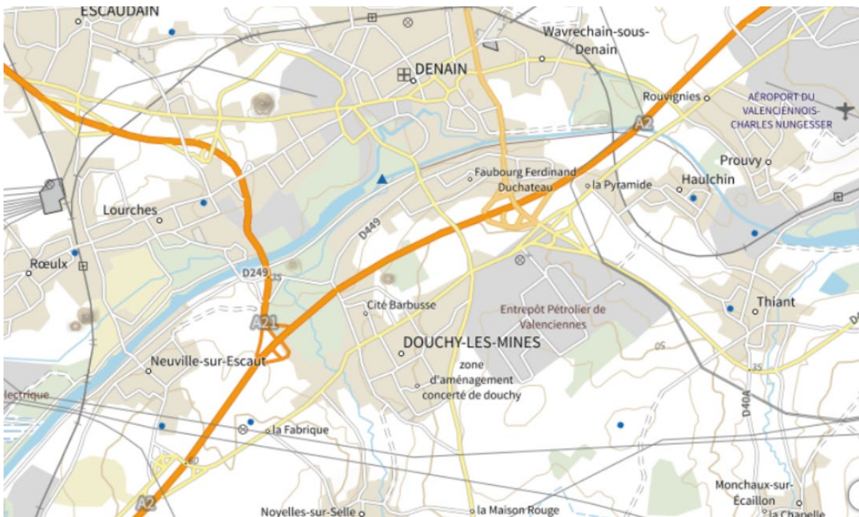
Localisation du secteur

Le développement de la ZAC du Château d'Eau à Douchy-les-Mines permet l'investissement en faveur du développement économique et de l'emploi sur le territoire de la CAPH, et d'escompter de réels impacts positifs :