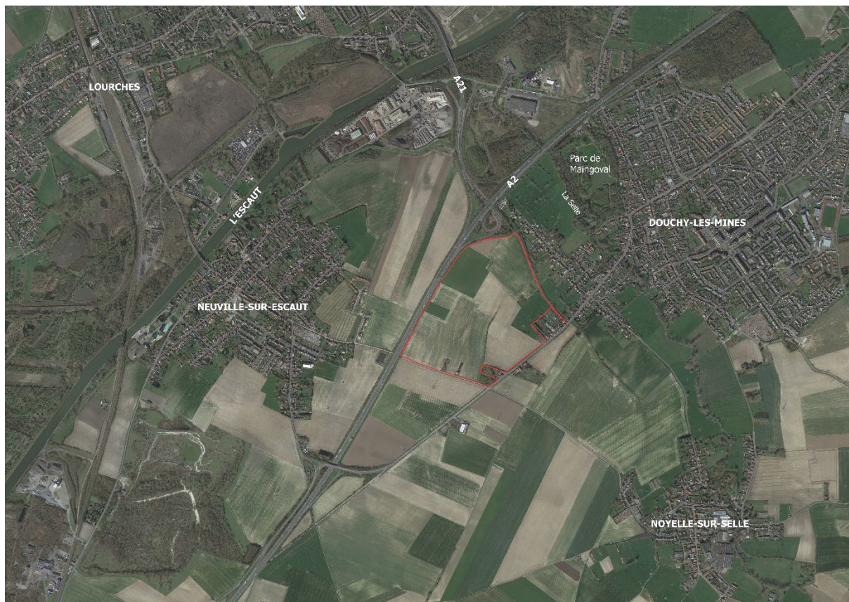
Périmètre de l'opération de la Zone d'Activité Economique du Château d'Eau à Douchy-les-Mines

Le périmètre de la future zone d'activité économique se situe à Douchy-les-Mines et est compris approximativement entre l'Avenue de la République (D630), l'A2 et le chemin du Château d'Eau. Il s'étend sur environ 44 ha.