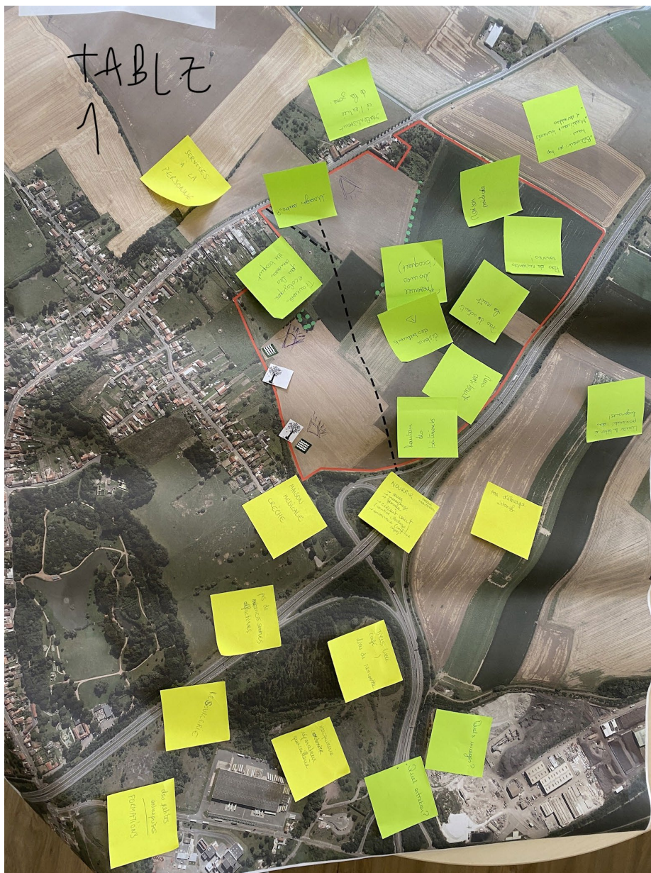
Résultats des ateliers de co-construction avec les habitants (table n°1)

Le bilan de cet atelier de co-construction est tiré aux pages suivantes et a permis à l'équipe d'AMO de formaliser le schéma de synthèse des principes d'aménagements de la future Zone d'Activité Economique.