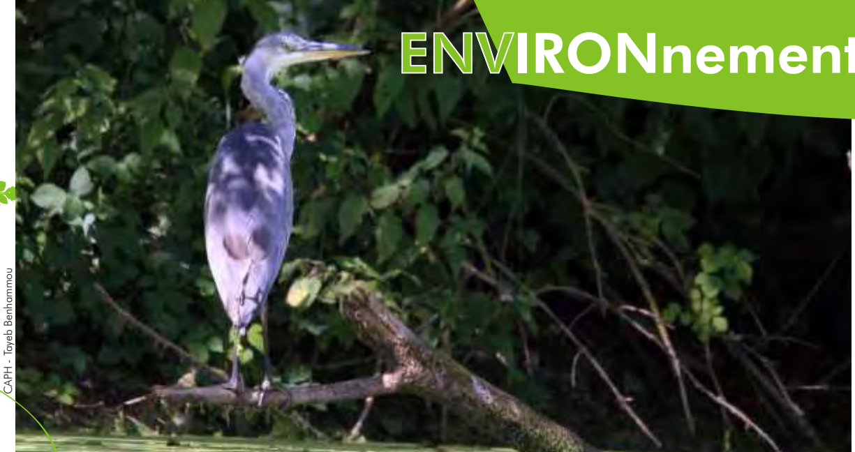
CAPH - Toyeb Benhammou

Toujours prévoir une protection contre le gel, planter pomme de terre, oignon blanc, persil et poireau, semer laitue, betterave, pois et radis, diviser les souches de rhubarbe.