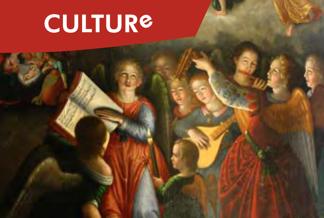
"Le chant des Anges" de Godfried Marséus - vers 1625