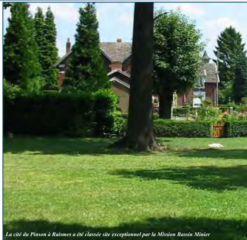
La cité du Pinson à Raismes a été classée site exceptionnel par la Mission Bassin Minier

Car la période actuelle est décisive : dans les quinze ans à venir, les ayants droit (47 % des occupants actuels) auront quasiment tous été remplacés par des locataires. Or, les chiffres sont éloquentes sur la réalité de l'occupation de ce patrimoine. En effet, à titre d'exemples, plus de