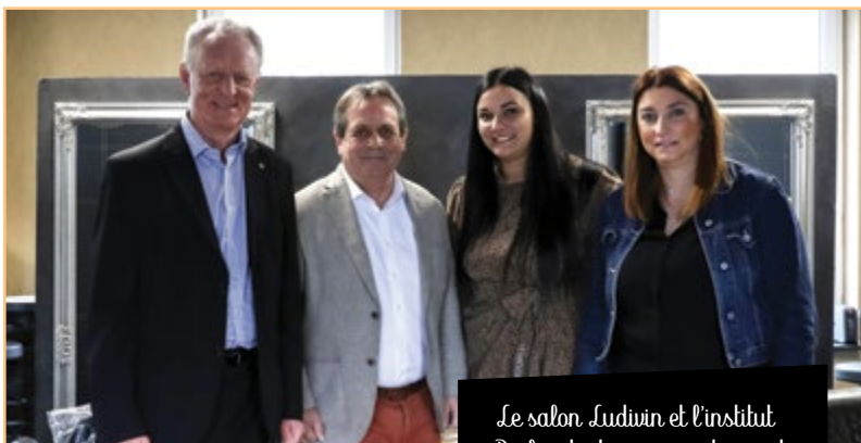
Le salon Ludivin et l'institut Perles de douceurs ont ouvert leurs portes à Hasnon.

Au total, ils ont bénéficié de l'aide de notre Agglo en faveur des TPE à hauteur de 6000 €.