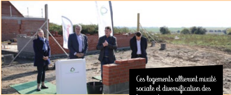
Ces logements allieront mixité sociale et diversification des logements proposés.

panneau photovoltaïque et sera construit de façon à être économe en énergie. L'Agglo finance ce projet à hauteur de 90 000 € via ses fonds propres et 67 020 € d'aides déléguées de l'État.