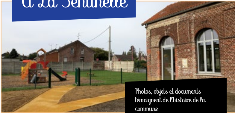
Photos, objets et documents témoignent de l'histoire de la commune.