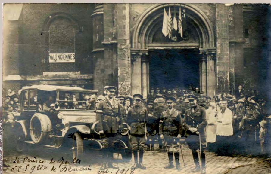
Le Prince de Galles, le lieutenant-général Sir A. Currie (commandant du corps d'armée anglais) et le général Davie Watson (commandant la division canadienne) devant l'église Saint-Martin de Denain à la libération de la ville, le 19 octobre 1918.