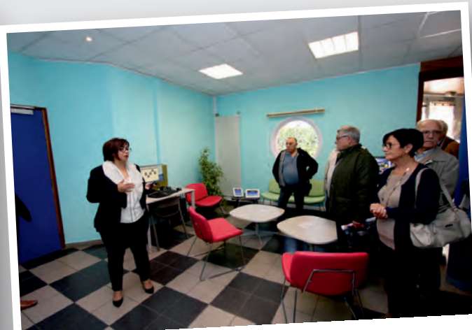
5 octobre Inauguration du Salon numérique de Saint-Amand-Les-Eaux