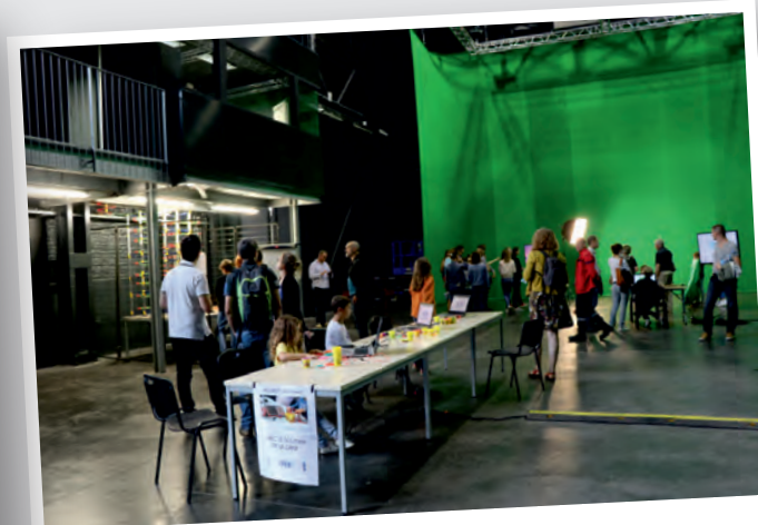
13 et 14 octobre Fête de la Science à Arenberg Creative Mine