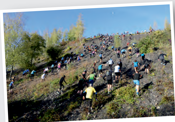
30 sept Course des terrils à Raismes