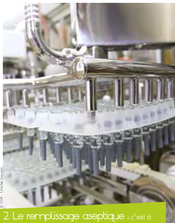
2. Le remplissage aseptique : c'est à ce moment-là que les seringues ou les flacons sont remplis de façon stérile.

Implanté sur 17 hectares, on trouve sur ce site 14 bâtiments dédiés à la qualité, au conditionnement, au remplissage aseptique en flacons et seringues, à la lyophilisation, aux utilités, à la logistique et un magasin. Le tout sur quelque 25 000 m 2 . Il emploie près de 700 personnes mais ne s'arrête pas là et poursuit son ascension. Au total, en 2015, une centaine d'emplois devraient être créés. Une opération que le groupe belge devrait renouveler dans les trois années à venir. En parallèle, il double également sa capacité de production en passant de 70 à 140 millions d'unités. Des produits parmi lesquels on trouve des vaccins contre la méningite, la diphtérie, la grippe et contre les infections à pneumocoque. Autant de productions distribuées ensuite dans quelque 125 pays. Rappelons que le groupe a injecté ici près de 600 millions d'euros, ce qui en fait le deuxième plus gros investissement international de la région !