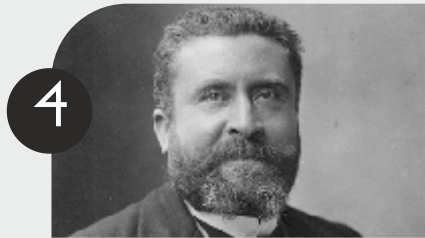
Jean Jaurès, 1904

03.27.48.39.65 ou contact@tourisme- porteduhainaut.fr