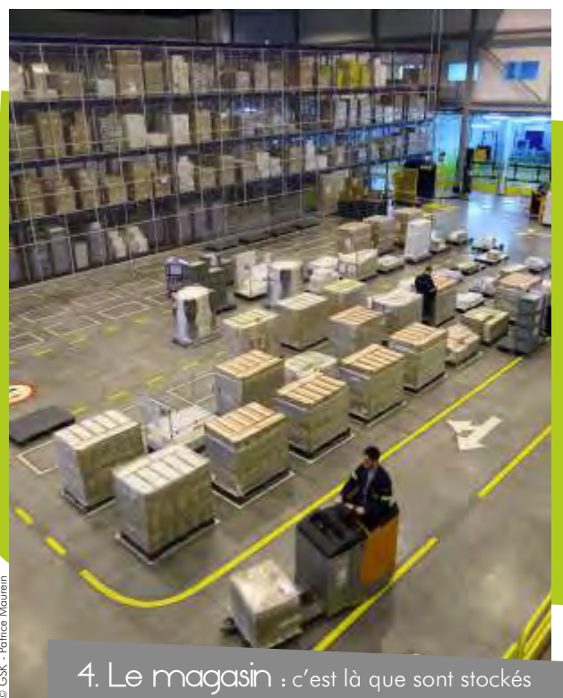
4. Le magasin : c'est là que sont stockés les produits avant d'être acheminés vers 125 pays.