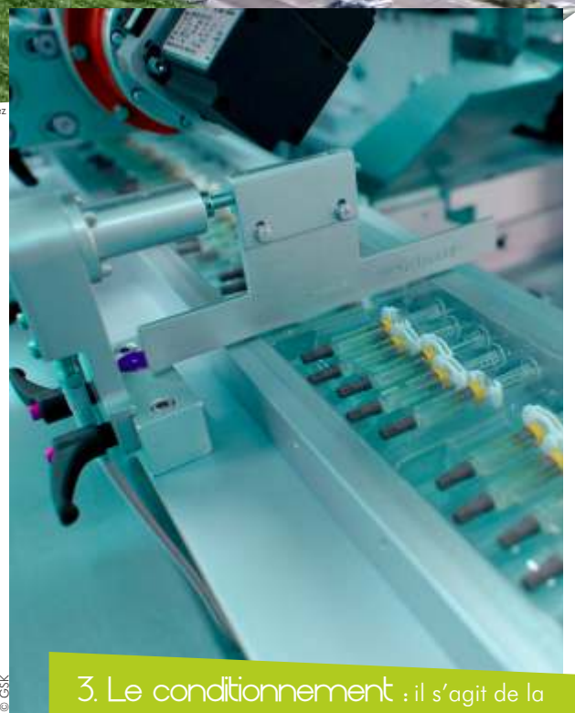
3. Le conditionnement : il s'agit de la mise en étui des flacons et seringues.