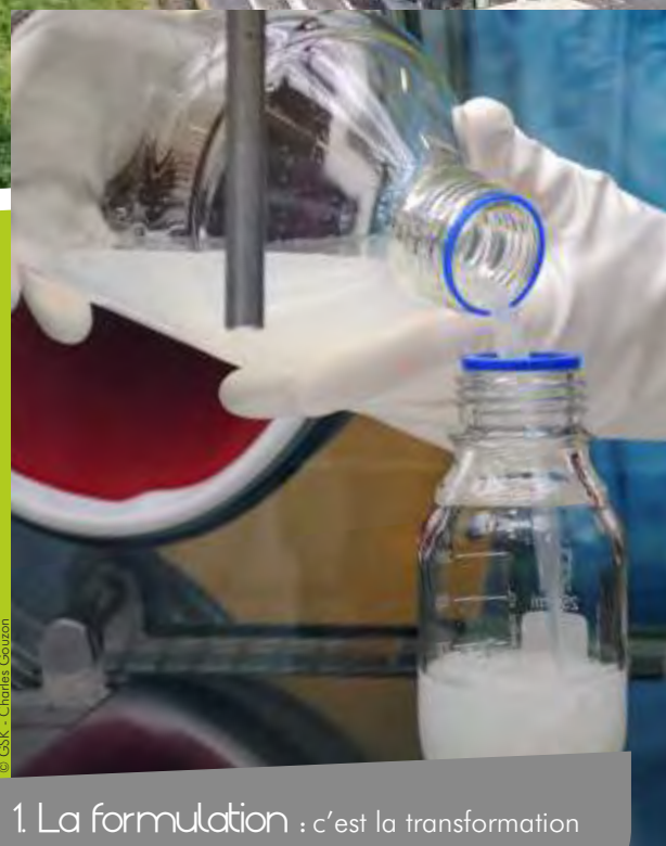
1. La formulation : c'est la transformation des antigènes bruts en vaccin.

Pour nous contacter ou nous donner votre avis : 03.27.09.05.02 horizons@ agglo-porteduhainaut.fr