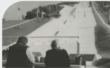
© Jorge Ribalta - Loismord Nœux-les-Mines