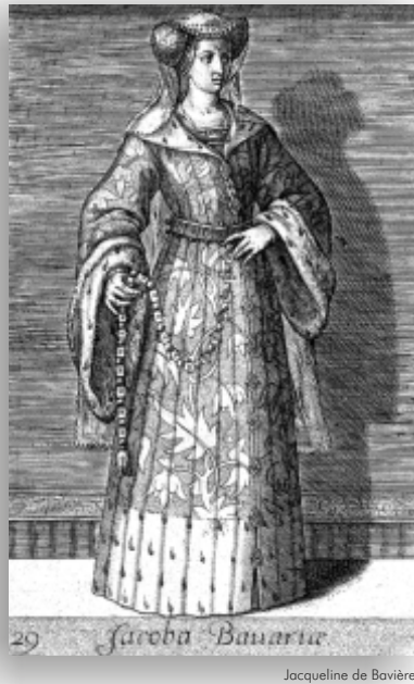
Jacqueline de Bavière

Tous les fils aînés des comtes de Hainaut étaient, par leur héritage, aussi comtes d'Ostrevant. Le siège de la châtelainie d'Ostrevant était, à l'origine, situé à Lumbres. Ce n'est qu'aux environs de 690 après Jésus-Christ qu'elle s'installe à Bouchain, sous l'impulsion de Pépin de Herstal. Le premier comte "officiel" de la châtelainie est Aldebert. Il est, avec sa fille Remfroye (ou Renfroie), le fondateur de l'abbaye de Denain en 764. Après 1080, Anselme II, surnommé Barbatu (le Barbu) prend la tête de la châtelainie d'Ostrevant. Il part en Terre Sainte, d'abord à Constantinople en tant qu'ambassadeur, puis à Antioche, en 1098, où il participe à la prise de la ville. C'est là qu'il laissera la vie, le 26 février 1099. Le dernier comte d'Ostrevant est une comtesse, Jacqueline de Bavière. Mariée plusieurs fois mais sans héritier, elle est contrainte de remettre le comté de Hainaut et ses autres possessions à son cousin, Philippe le Bon, duc de