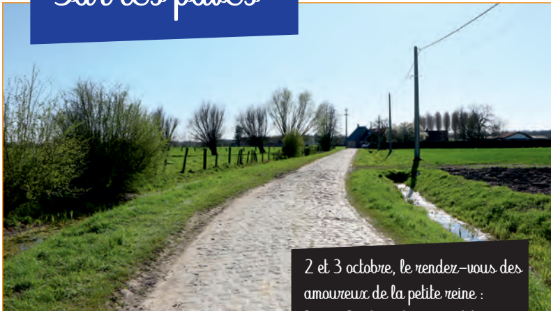
2 et 3 octobre, le rendez-vous des amoureux de la petite reine : Paris-Roubaix hommes et femmes.

La Porte du Hainaut sera présente les 2 et 3 octobre sur les secteurs pavés. Sur son stand, il sera possible de suivre l'épreuve sur écran avant et après le