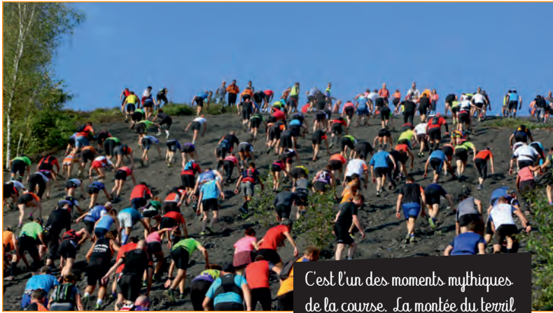
C'est l'un des moments mythiques de la course. La montée du terril de Sabatier.

tembre prochains. Allumés, authentiques, sauvages et autres fans de trail, soyez au rendez-vous !