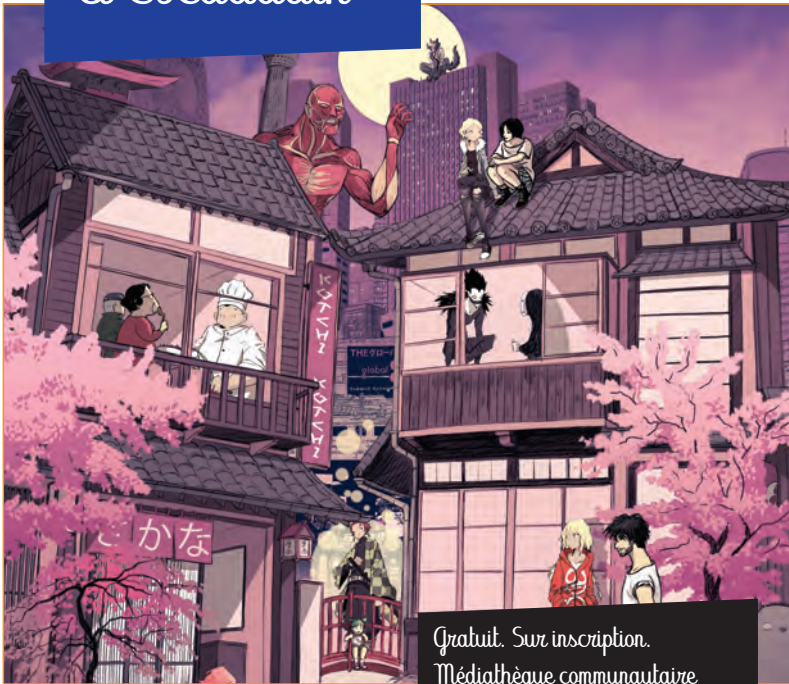
Illustration : Vanyda & Nicolas Hitori de

Gratuit. Sur inscription. Médiathèque communautaire d'Escaudain. 03.27.14.29.00.