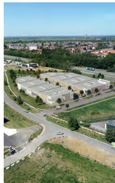
Perspective parc BVI © MV2 Architectes

La réception des bâtiments est prévue pour le premier trimestre de l'année prochaine.