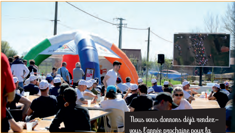
Nous vous donnons déjà rendez-vous l'année prochaine pour la troisième édition.

géant pour suivre les courses féminines et masculines, les fans de vélo ont répondu présents !