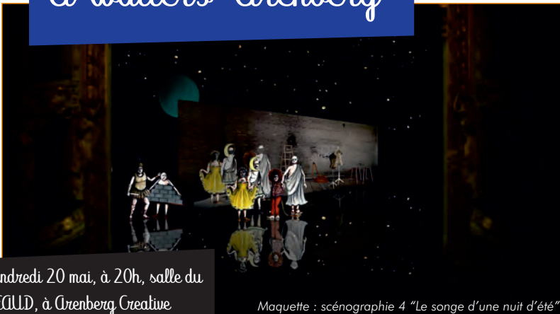
Vendredi 20 mai, à 20h, salle du LÉAUD, à Arenberg Creative Mine. 03.27.09.91.56.