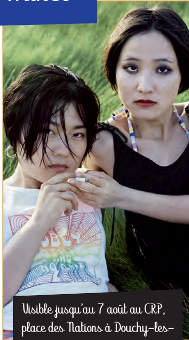
Visible jusqu'au 7 août au CRP, place des Nations à Douchy-les-Mines. Infos : 03.27.43.56.50

Le CRP (Centre Régional de la Photographie) vous propose de venir découvrir sa nouvelle exposition, Bi hu Suo / À propos de la photographie chinoise émergente . Quatre artistes originaire de l'Empire du Milieu, travaillant au cœur de la nouvelle scène photographique, vous présenteront leurs clichés et les thématiques qui les animent, sujets sensibles, actuels et délicats.