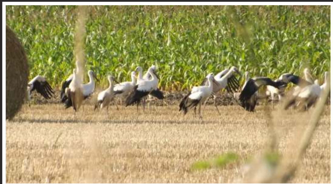
“Cigognes d’été... Grand froid annoncé ?” par Patrick WILLAI de Saint-Amand-les-Eaux