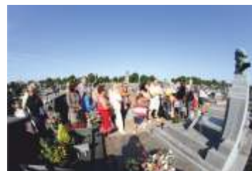
Le cimetière de Denain

Une fois les baies posées, l'avis du maître-verrier est pris en compte « son regard est important. » Car il arrive que l'harmonie visuelle ne soit pas au rendez-vous. « Les baies sont alors démontées puis refaites. C'est important d'être fier de son travail ! » ■