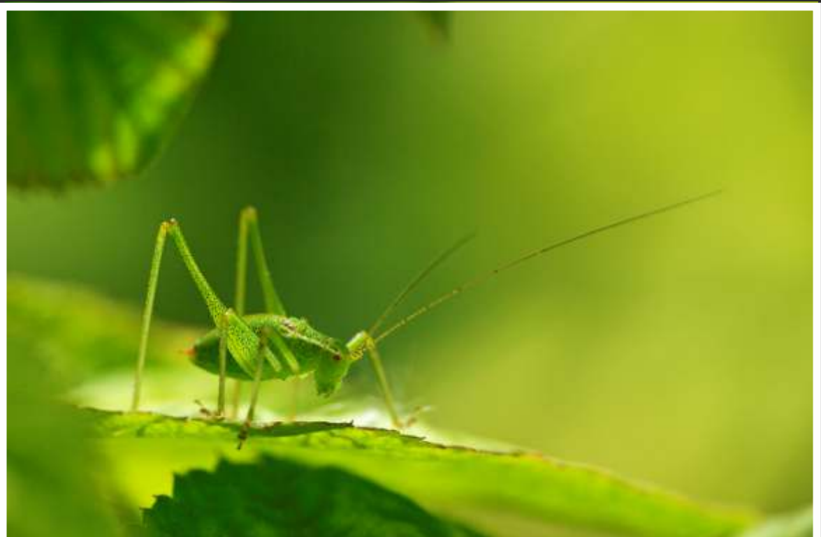
"L'anis poivrée" par Laurent LELIÈVRE de Saint-Amand-les-Eaux