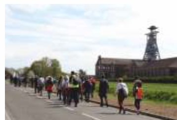
Le chemin de Compostelle