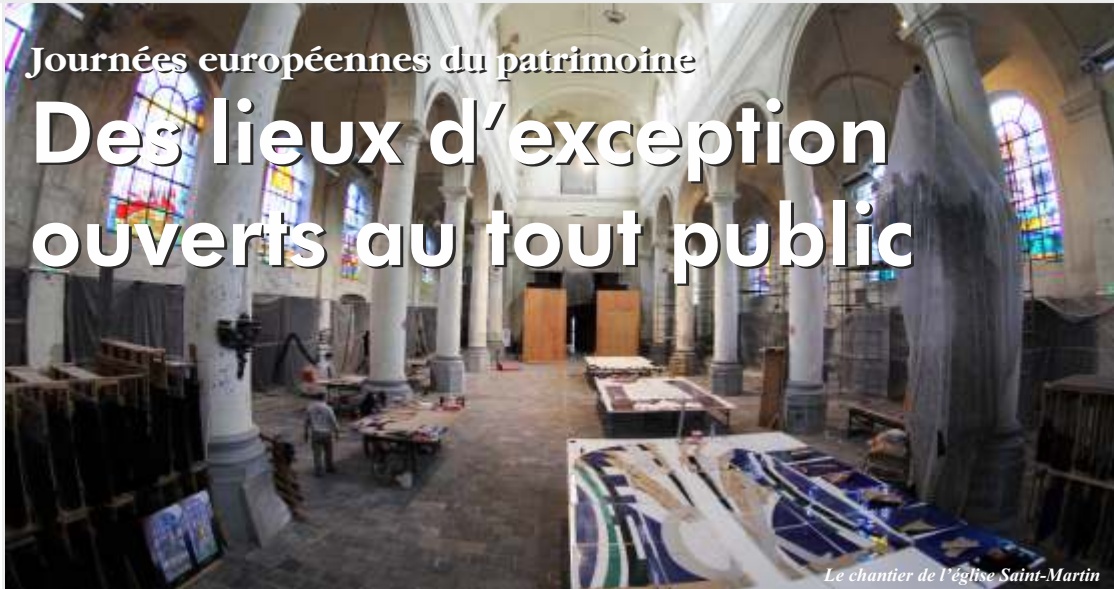
Le chantier de l'église Saint-Martin