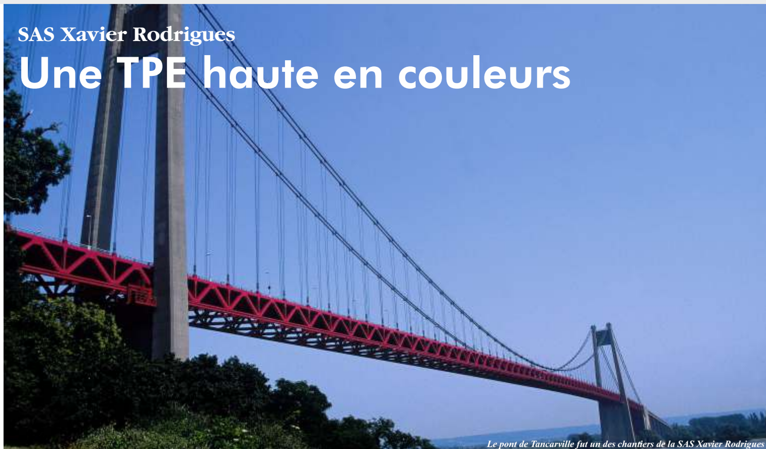
Le pont de Tancarville fut un des chantiers de la SAS Xavier Rodrigues