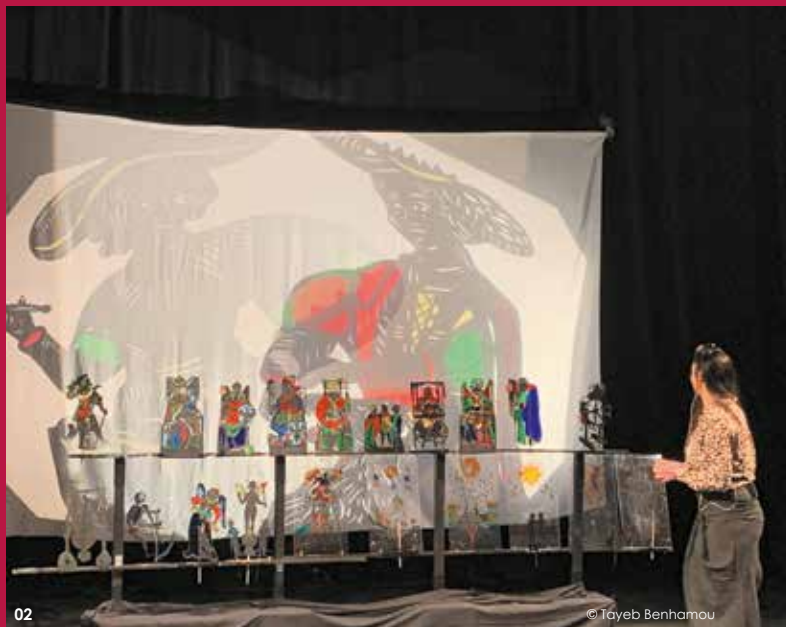
02 © Tayeb Benhamou