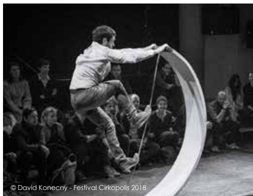
Festival Cirkopolis 2018