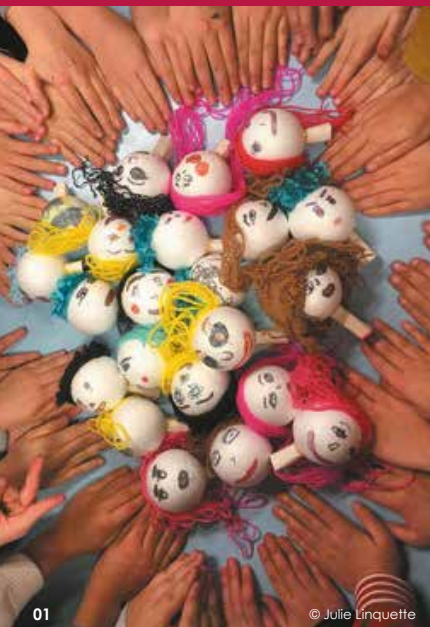
01 © Julie Linquette