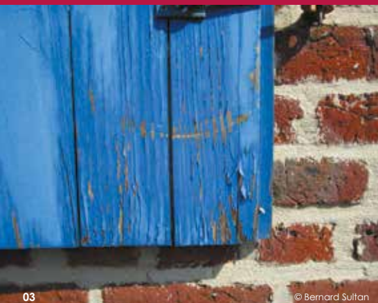
03 © Bernard Sultan